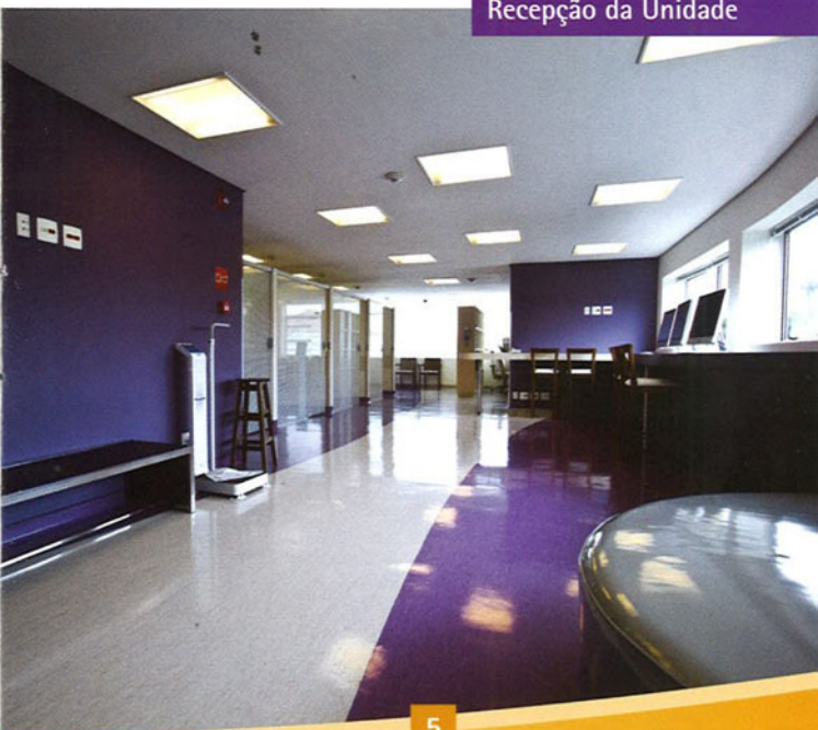
Recepção da Unidade